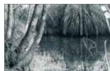
Palude Parco del Morbasco