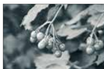
Bacche di sempreverde