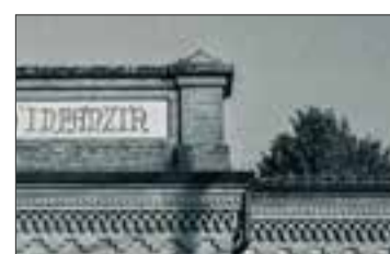
Scuola materna di Sesto