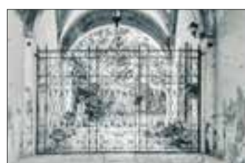
Casa Famiglia Davidi