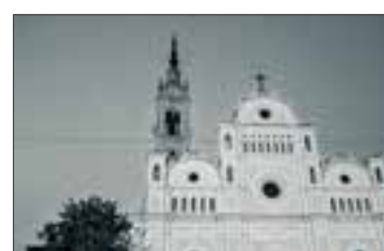
Facciata Chiesa Parrocchiale Scatto di Cosetta Frosi