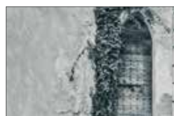
Porta d'accesso al campanile di Luignano