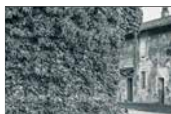
Cascina a Cortetano