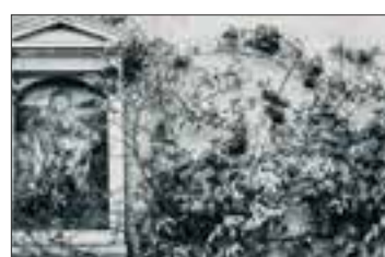
Immagine sacra in Cortetano Scatto di Cosetta Frosi