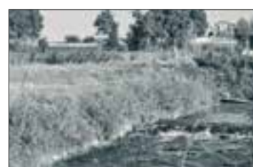
Cascatelle del Morbasco