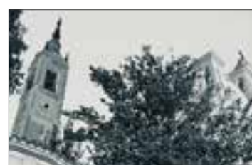
Particolare della Chiesa di Sesto